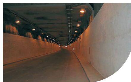
RIVESTIMENTO GALLERIA "CIRCONVALLAZIONE NORD" - ROMA