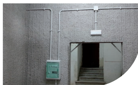
POSTE ITALIANE - CATANIA