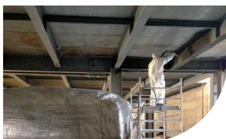
AEROPORTO - BARI