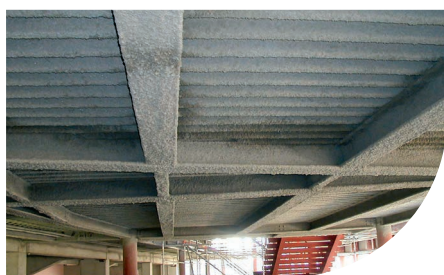
CINEMA MULTISALA - TORINO