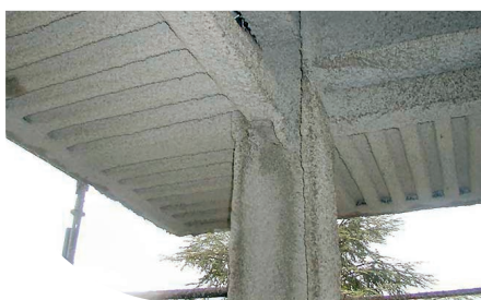
OSPEDALE - GRAVEDONA (CO)