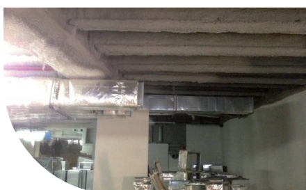
ENPAM - ROMA